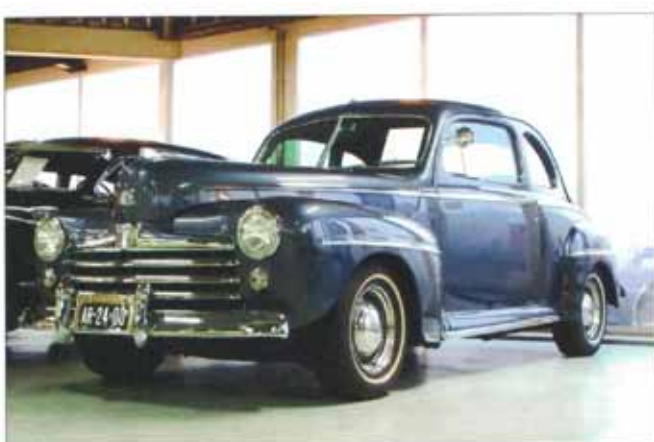
Introuwekkende Ford de Luxe Coupé