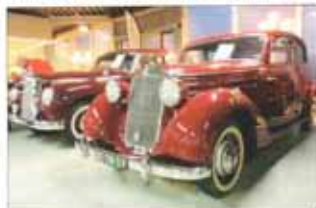
De Benziefhebber kan en mag hier niet omheen

De Autoveteranenclub nam prachtige auto's mee naar de voormalige Peugeot-showroom aan de Saturnusweg in Leeuwarden. Er stonden diverse vooroorlogse Amerikaanse Ford modellen tentoongesteld. Er waren schitterende MG's. Het publiek kon de unieke DKW F7 - die een rol vervulde in de historische speelfilm 'Sol-