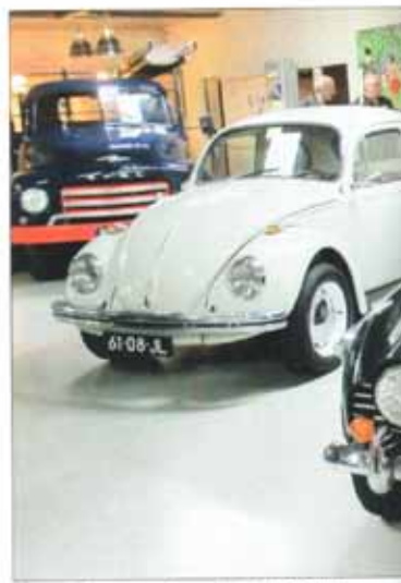
Harmonie tussen veelgeproduceerde Kever en zeldzame Triumph TR250