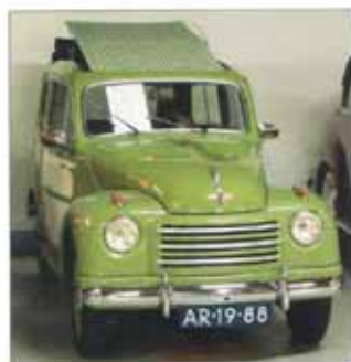
Foto links onder: In prachtige natuurgetrouwe staat. De Fiat Topolino Belvedere