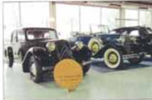
De Traction Avant 7C en Ford de Luxe gebroederlijk naast elkaar

daat van Oranje' - bewonderen. Ook de Opel Kapitán uit de Kameleon kon worden aanschouwd. Mercedes-Benz fans kwamen bijvoorbeeld aan hun trekken dankzij de aanwezigheid van een Adenauer Benz, type 300 A. In de categorie 'geen dagelijkse kost' hoorde bijvoorbeeld ook de Triumph TR 250 thuis. Elders