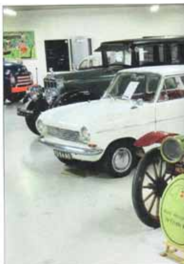
AVC De Fryske Walden herbergt prachtige voor- en naoorlogse klassiekers